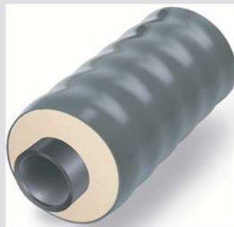
ТВЭЛ-ЭКОПЭКС с кожух-каналом